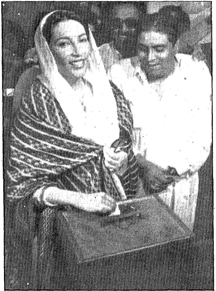
Benazir Bhutto, dirigente del Partido Popular de Pakistán, deposita su voto en su localidad natal, Nau Dhero, al sur del país

De los 237 escaños de la Asamblea Nacional, 217 son elegidos por el sufragio universal, mientras que los 20 restantes, que están reservados para mujeres, son designados por el voto de la propia Asamblea.