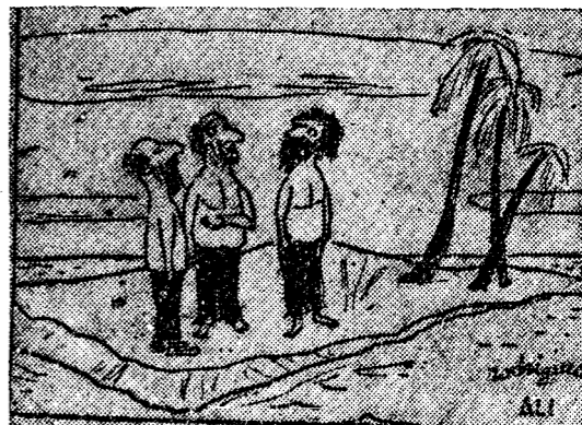
—Carlos, permítame que te presente a un buen amigo mío.

Estados Unidos. Terminó diciendo que su embarcación iba equipada con un pequeño motor, pero que raras veces lo utilizaba, puesto que prefería la navegación a vela.—EFE.