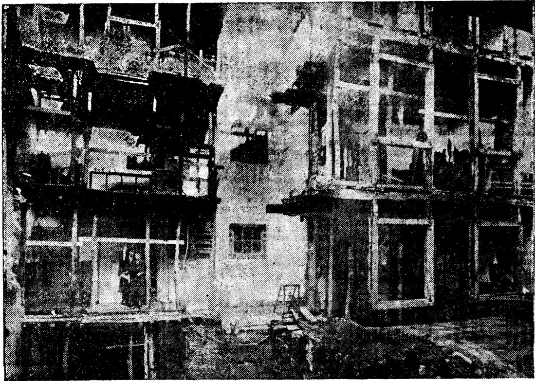
En reiteradas ocasiones hemos comentado el caso de unas viviendas emplazadas entre la calle Real y la Galería, cuyas actuales condiciones constituyen un serio motivo de inquietud. Las viviendas presentan el dramático aspecto que recoge la foto, y carecen de los más elementales servicios higiénicos, por lo que los residentes van a parar a un patio interior, con el consiguiente peligro de una grave infección, todavía mayor en esta época estival. Urge poner remedio a esta imcomprensible situación, que pone en peligro la salud de los coruñeses y la vida de los inquilinos, carentes de toda la fachada posterior.