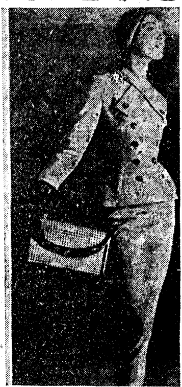
Elegante modelo de Givenchy, en twerd beige y blanco.