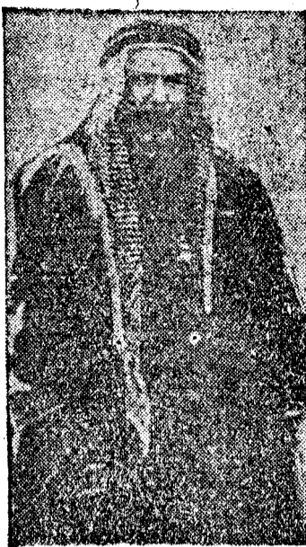
El hombre que gana cien millones de pesetas cada semana