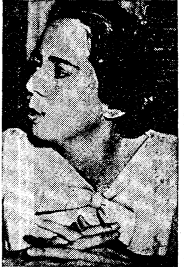
Vilma Espín, ha trocado su atuendo de guerrillera fidelista por el normal en una joven mujer. La foto fue obtenida cuando declaró que contraerá matrimonio con Raúl Castro, hermano de Fidel, y uno de los principales jefes del ejército de guerrilleros.

Una alemana nacida en Vigo. Mientras aguardábamos el resultado de las gestiones, se aproximó a nosotros una joven de pelo y ojos claros, vestida con pantalones, jersey blanco y una de esas chaquetas de esquiador que aquí se llaman "anorak". Iba algo extraña para andar por Bonn y, sin embargo, favorecida.