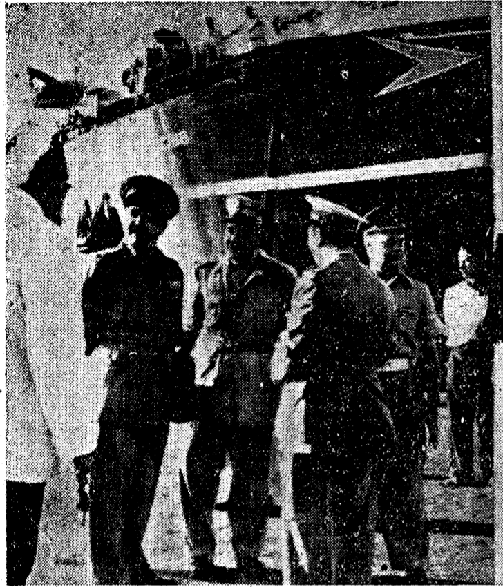
Varios jefes del ejército egipcio aparecen fotografiados en Suez, despidiendo al último oficial británico que abandonó la zona del canal, finalizando así la evacuación de tropas inglesas en Egipto.