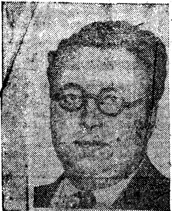
El astrólogo del ejército británico

Louis de Wohl, "astrólogo del Estado Mayor británico", acaba de revelar en unas sorprendentes memorias los detalles de su participación en la guerra de 1939 a 1945.